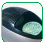
Lata de Aromas

Dimensiones: 36 x 16 x 30 cm Consumo: 40 W Peso: 3.65 kg Caudal del Aire: 120 m 3 /h 3 velocidades Temporizador: 1, 2, 4, 8 horas Color: Negro / Gris metalizado EAN: 3700046511504 Certificación: CE/TUV/GS/ROHS