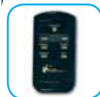
Mando a distancia