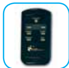
Mando a distancia