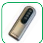
Mando a distancia