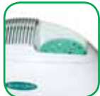
Lata de Aromas

Dimensiones: 36 x 16 x 30 cm Consumo: 40 W Peso: 3.65 kg Caudal del Aire: 120 m 3 /h 3 velocidades Temporizador: 1, 2, 4, 8 horas Color: Blanco / Verde EAN: 3700046511511 Certificación: CE/TUV/GS/ROHS