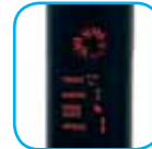
Panel de control electrónico

Movimiento bidireccional Mando a distancia