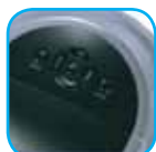
Cuadro de mandos