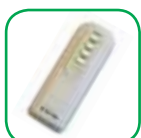
Mando a distancia